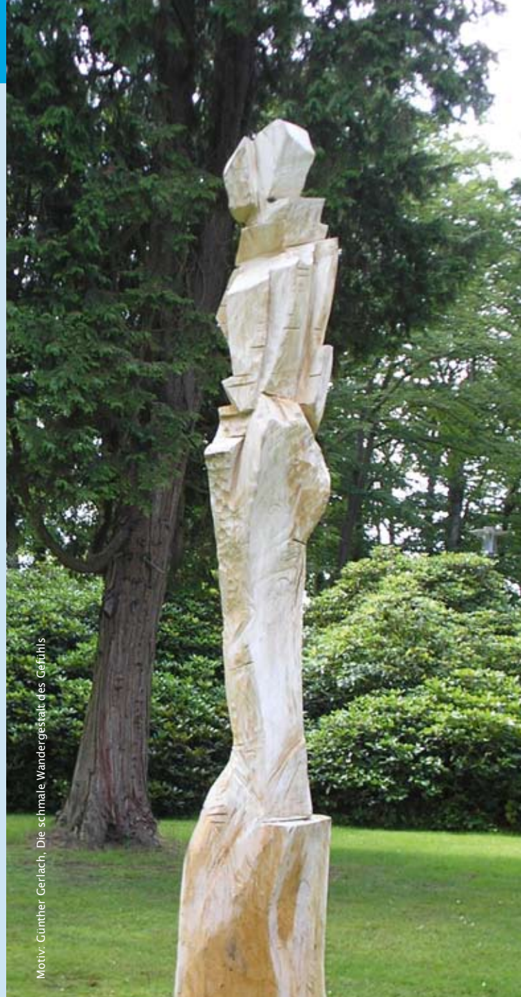
Motiv: Günther Gerlach, Die schmale Wandergestalt des Gefühls

„... am östlichen Fenster erscheint ihm die schmale Wandergestalt des Gefühls ...“ Paul Celan