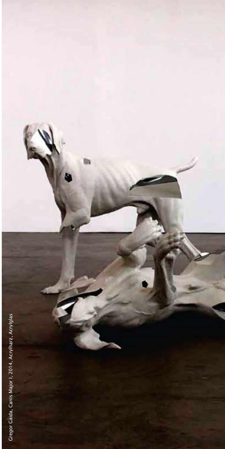
Gregor Gaida, Canis Major I, 2014, Acrylharz, Acrylglas

Führungen durch die Ausstellung (Lange Nacht der Museen)